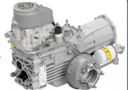
BCS 780 HY StarGate