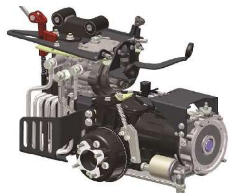
BCS 770 HY PowerSafe®